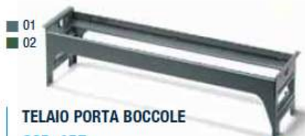
TELAIO PORTA BOCCOLE COD. ART.