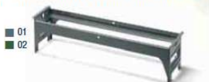
TELAIO PER PORTA UTENSILI IN MULTIPLEX COD. ART.