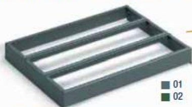
TELAIO PORTA BOCCOLE A 3 FILE COD. ART.