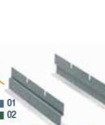
COPPIA SUPPORTI INCLINATI COD. ART.