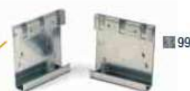
COPPIA SUPPORTI INCLINATI ZINCATI COD. ART.