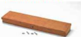
PORTA UTENSILI IN MULTIPLEX DA FORARE COD. ART.